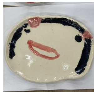
作品例「おねえちゃん」