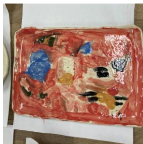
作品例「こうなった」