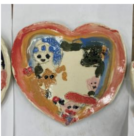
作品例「わたしのハート」